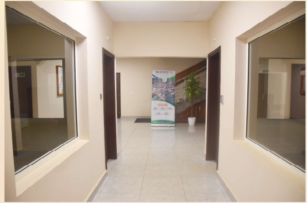
8 BUREAUX AU RDC