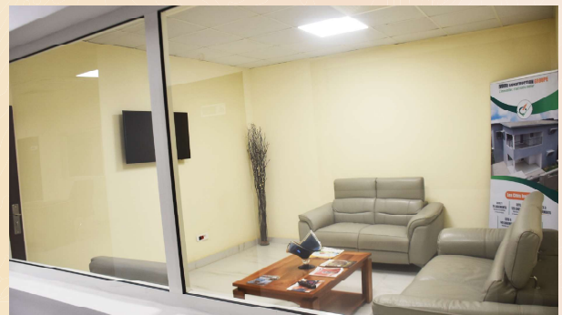
SALLE D'ATTENTE VIP