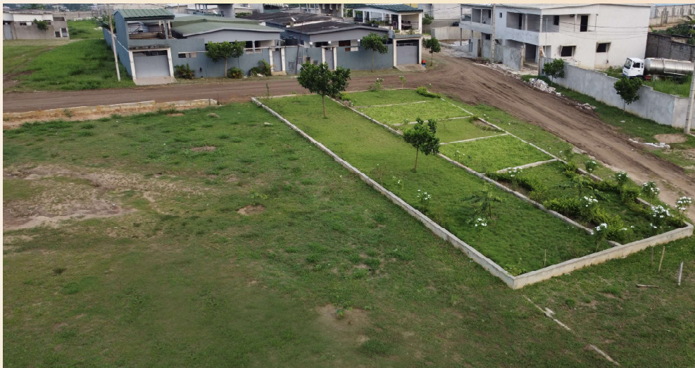
UN ESPACE VERT À LA CITÉ 3