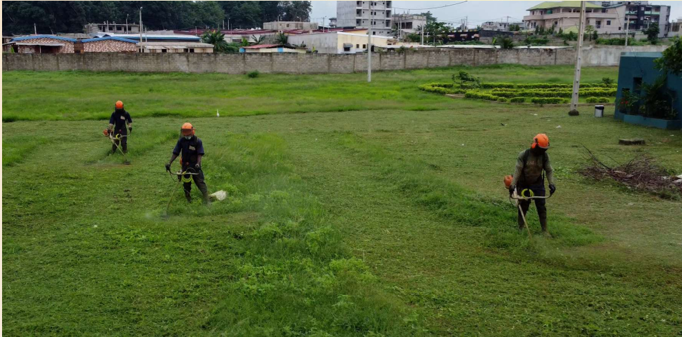
DES TECHNICIENS EN PLEIN ENTRETIEN DE LA CITÉ 5