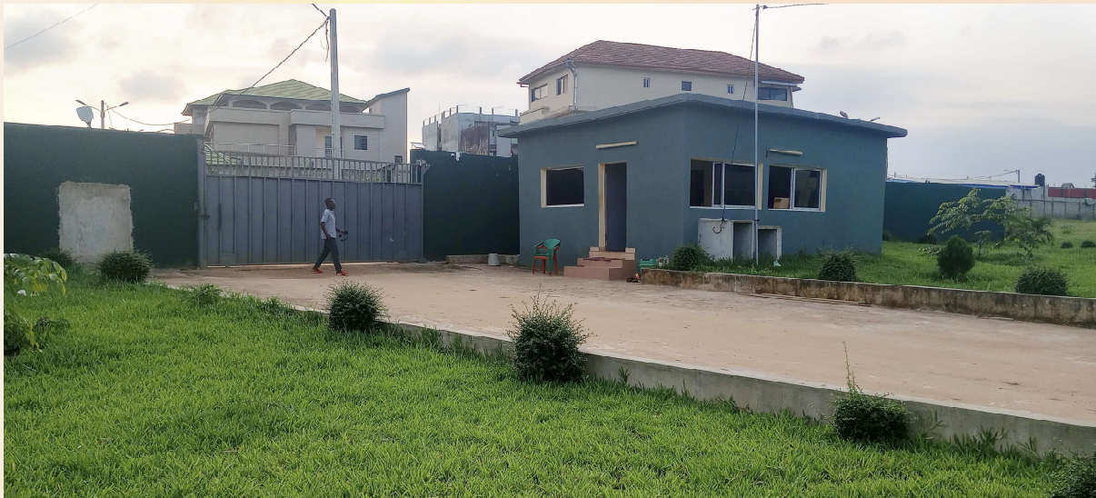
LA GUÉRITE DE LA CITÉ 5