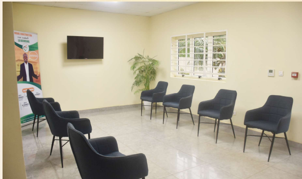
SALLE D'ATTENTE DU RDC