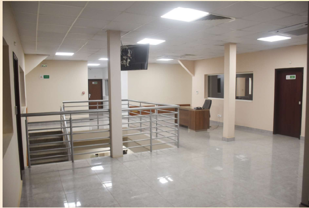
8 BUREAUX À L'ÉTAGE