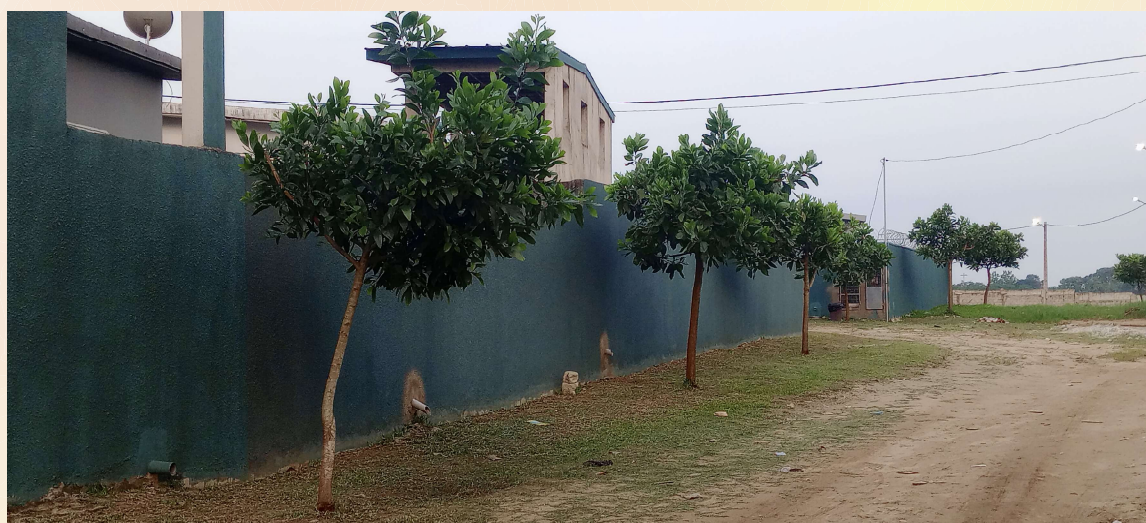
LES RUES DES CITÉS 3 EMBELLIES PAR DE BEAUX ARBUSTES