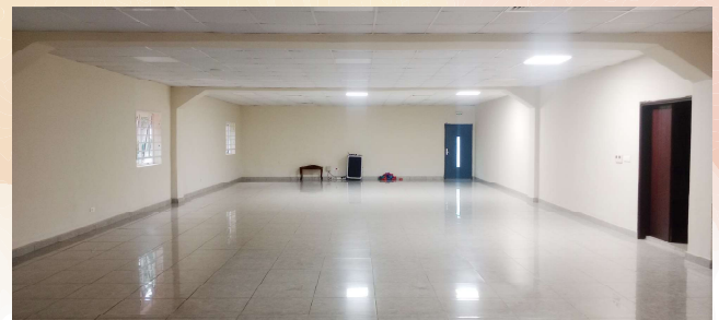
LA SALLE DE CONFÉRENCE