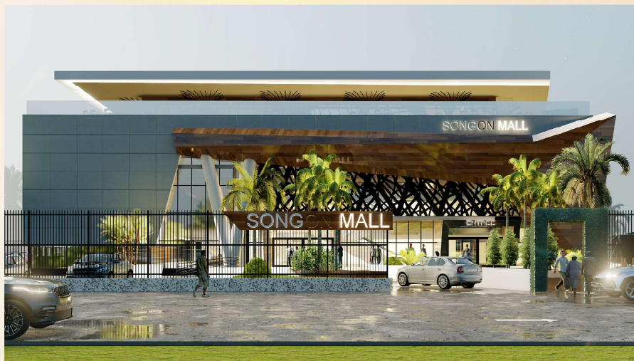
UNE IMAGE 3D DE L'HYPERMARCHÉ - VUE DE FACE.

Pour répondre aux besoins quotidiens de notre aimable clientèle et assurer leur autonomie, Ivoire Construction à en projet, la réalisation d'un hypermarché de premier ordre. Situé au cœur de notre communauté, cet hypermarché proposera une vaste gamme de produits et services, allant des produits alimentaires aux articles ménagers, en passant par des équipements électroniques et bien plus encore. Notre objectif est de faciliter la vie de nos résidents en leur offrant un accès facile et pratique à tout ce dont ils ont besoin, le tout dans un cadre agréable et moderne.