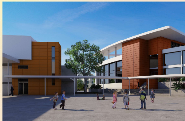
IMAGE 3D DU COMPLEXE SCOLAIRE

En fournissant un cadre éducatif intégré et moderne, ce complexe permettra aux familles de nos cités d'accéder à une éducation de qualité sans avoir à se déplacer loin de chez elles. Ce projet vise à créer une communauté éducative cohérente où l'excellence académique et le développement personnel sont au cœur de notre mission, garantissant ainsi un avenir prometteur pour tous les enfants et jeunes adultes de nos résidents.