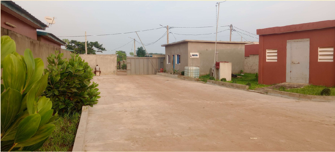
LA GUÉRITE DE LA CITÉ 4