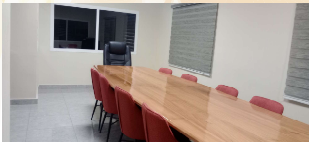
LA SALLE DE RÉUNION