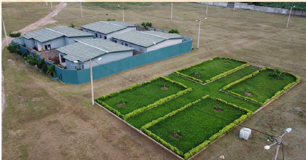
UN ESPACE VERT À LA CITÉ 5