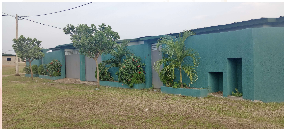
CITÉ 5 : UN ARBRE DEVANT CHAQUE MAISON