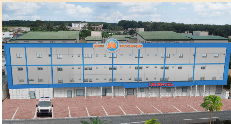
IMAGE DE PROJECTION DE LA POLYCLINIQUE VUE DE FACE