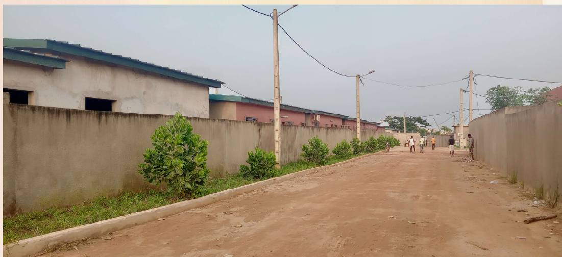
VERDURE ET ARBUSTES LE LONG DE LA RUE DES CITÉS IVOIRE