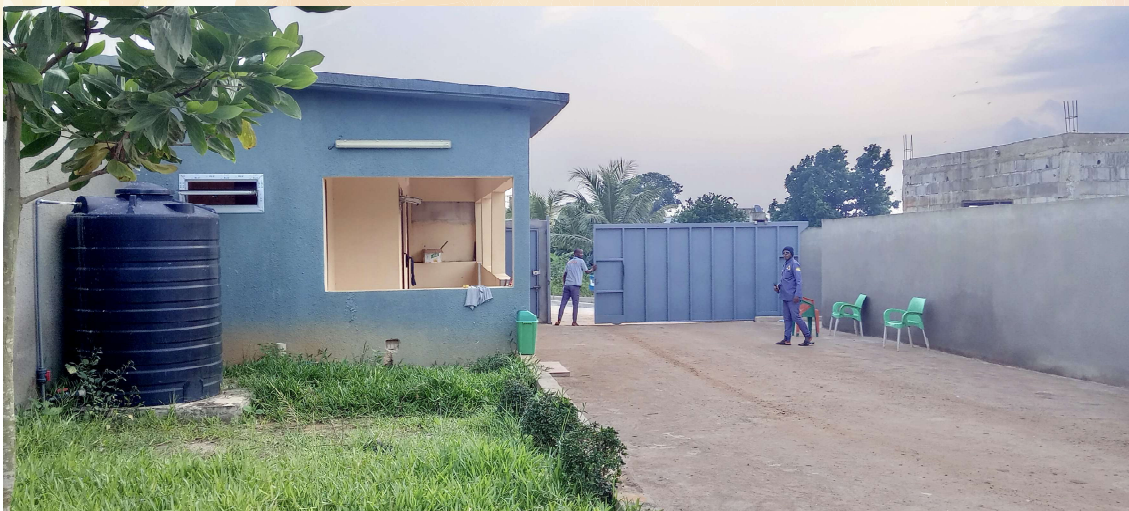
LA GUÉRITE DE LA CITÉ 3