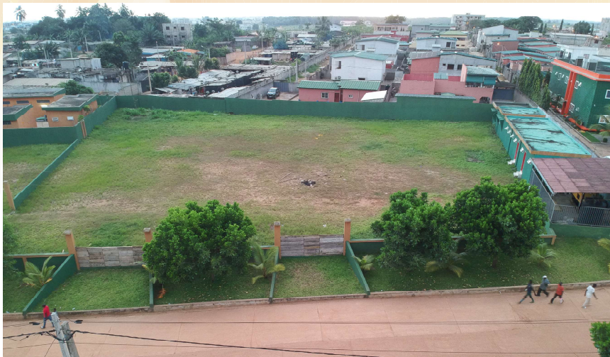
LE SITE RÉSERVÉ À LA CONSTRUCTION DE L'HYPERMARCHÉ